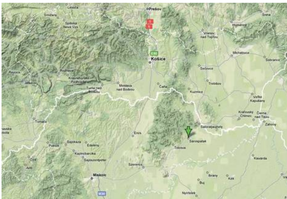
Mapový podklad prevzatý z portálu maps.google.com

Komenského uhorské pôsobisko bol Blatný Potok (maarsky Sárospatak ), ktorý leží neľaleko slovenskej hranice v tokajskej vinohradníckej oblasti. Základné údaje o meste a o jeho histórii uvádza en.wikipedia . Dnešný pohľad na mesto s dôrazom na kultúrne a historické pamiatky ponúka aj webová prezentácia, ktorú tu otvoríte priamo na stránke venovanej Reformovanému kolégiu a s zmienkou o tunajšom pôsobení J. A. Komenského.