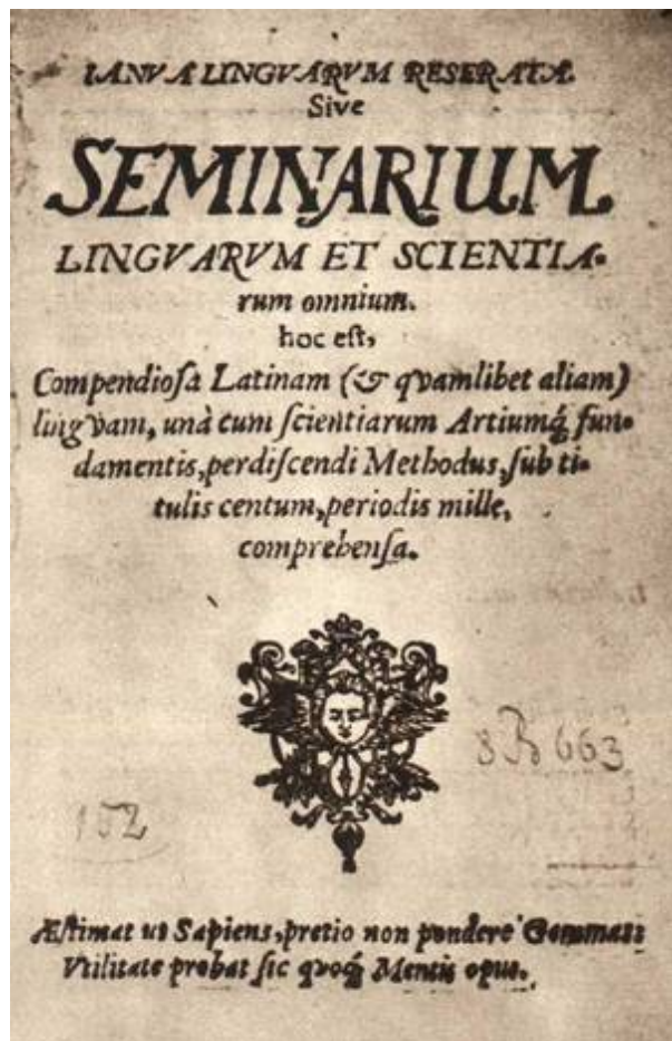
Janua linguarum reserata