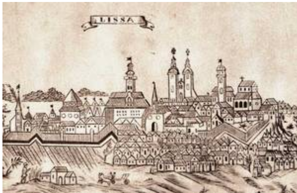
Lešno, miesto Komenského pobytu v Poľsku