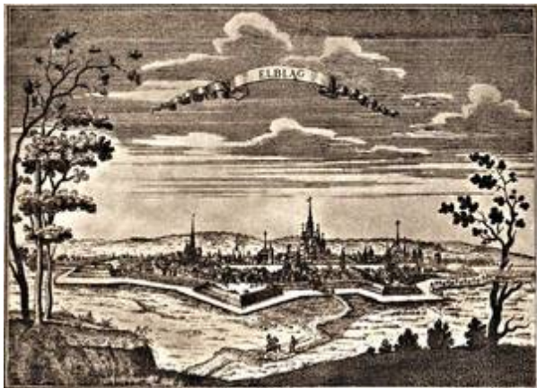
Elbląg, severo-poľské mesto kontrolované Švédmi